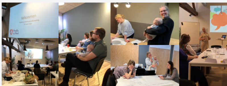
Foto: Forældre og Fødsel - fra generalforsamlingen i 2022

Seneste nyt fra Forældre og Fødsel. God læselyst!